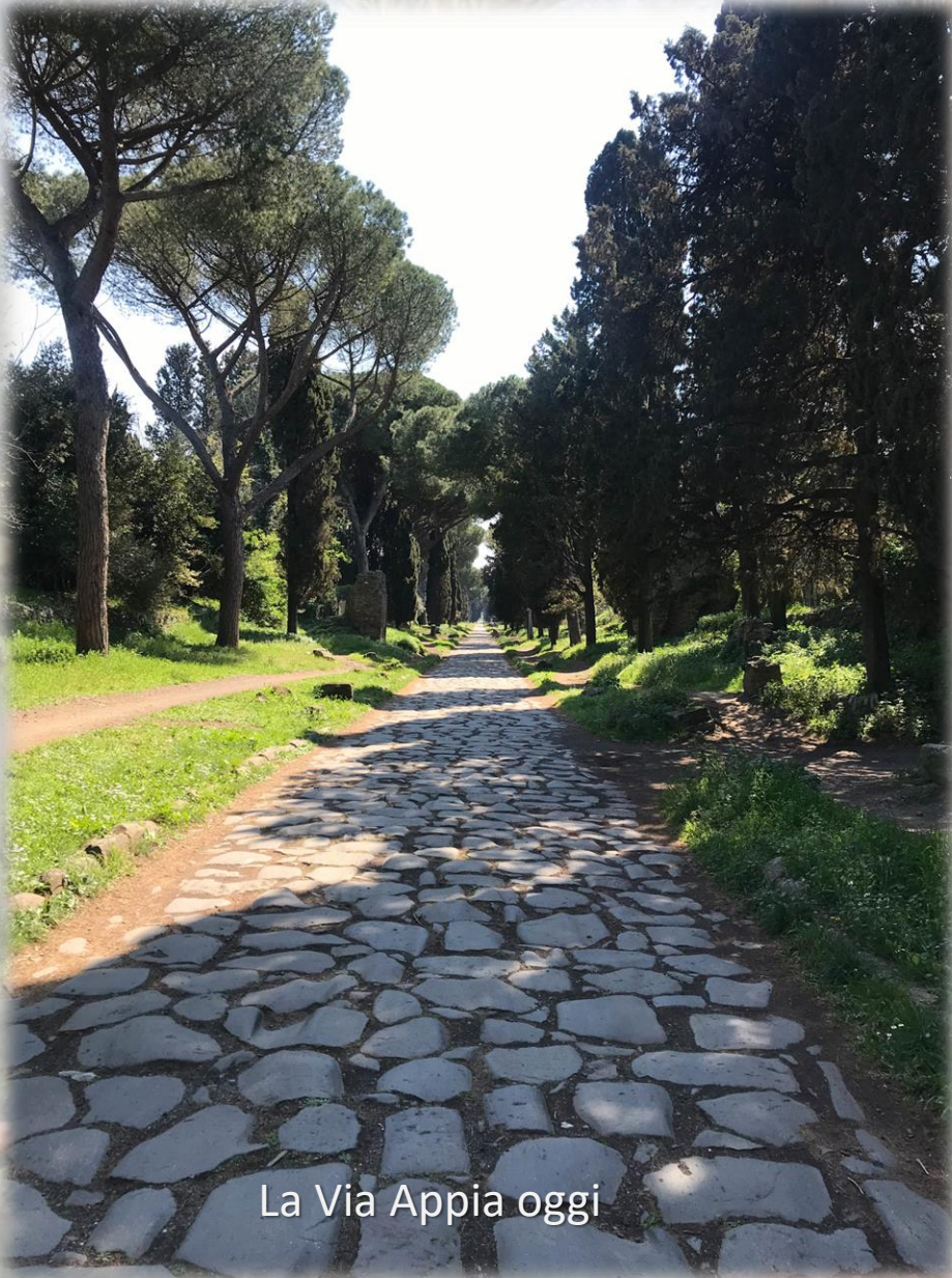
La Via Appia oggi