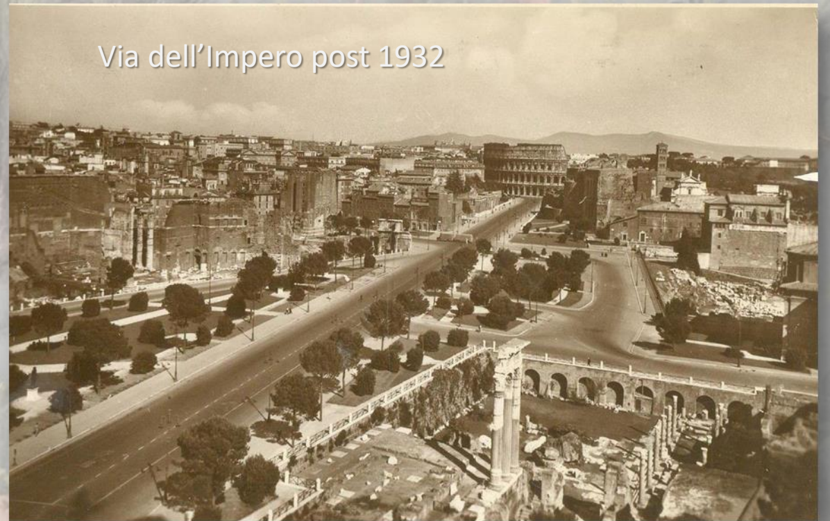
Via dell'Impero post 1932