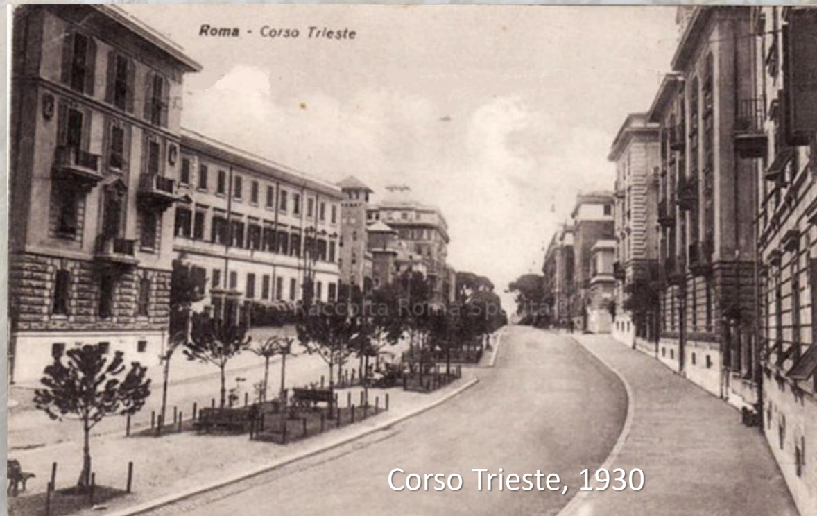
Roma - Corso Trieste