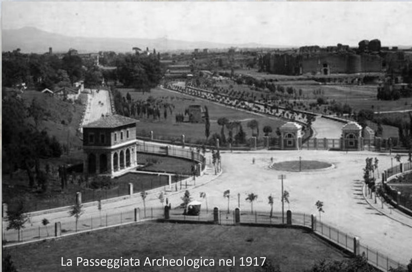
La Passeggiata Archeologica nel 1917