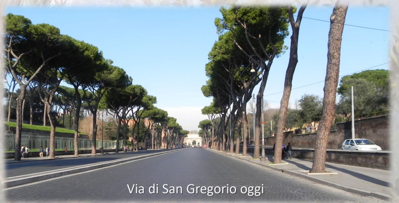
Via di San Gregorio oggi