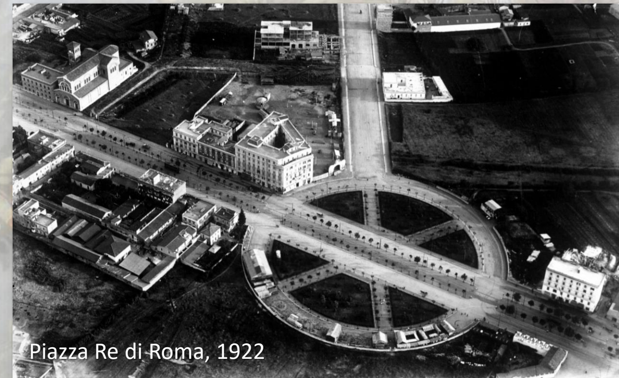
Piazza Re di Roma, 1922