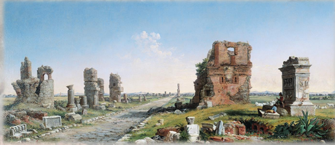
Parte dell'antica Via Appia fuori di Porta S. Sebastiano circa tre miglia.