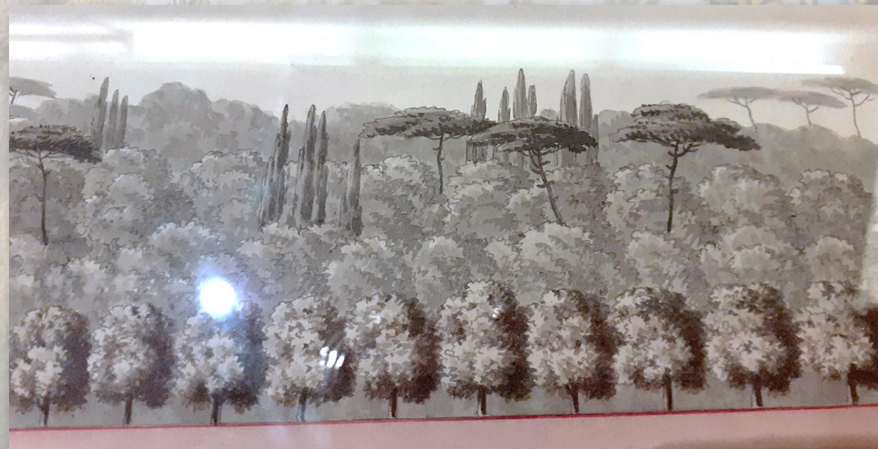
Progetto del Jardin du Capitole , 1813