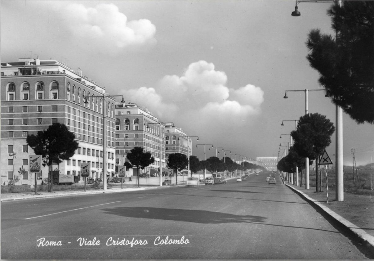
Roma - Viale Cristoforo Colombo