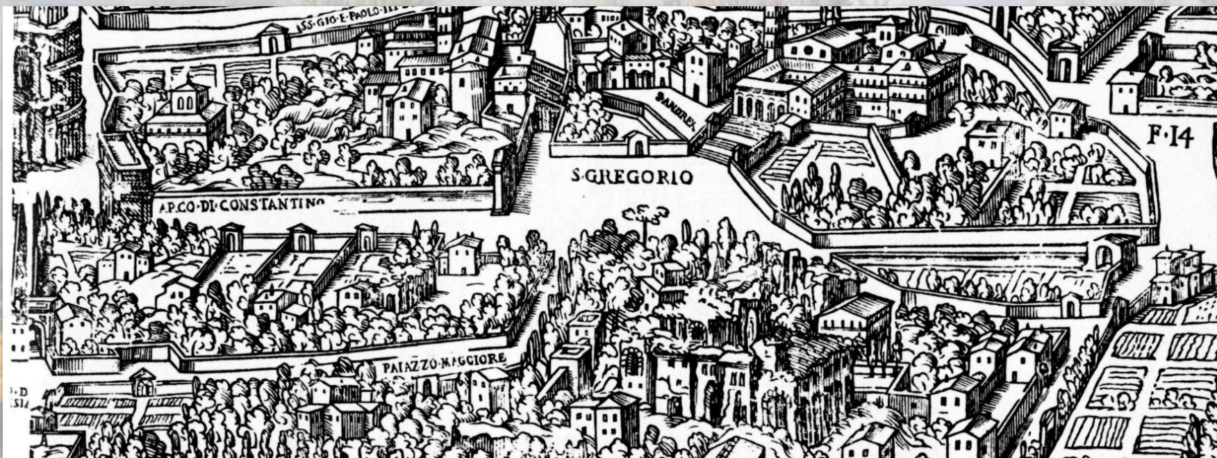
Pianta di Roma di Giovanni Maggi, 1625