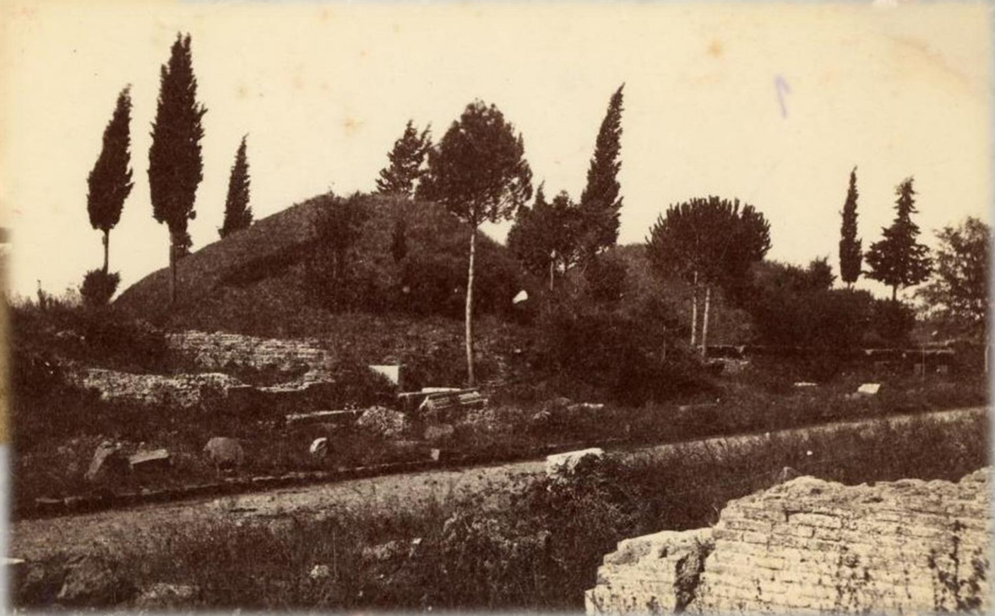
Tomba dei curiazi Via Appia Antica, 1860 ca.