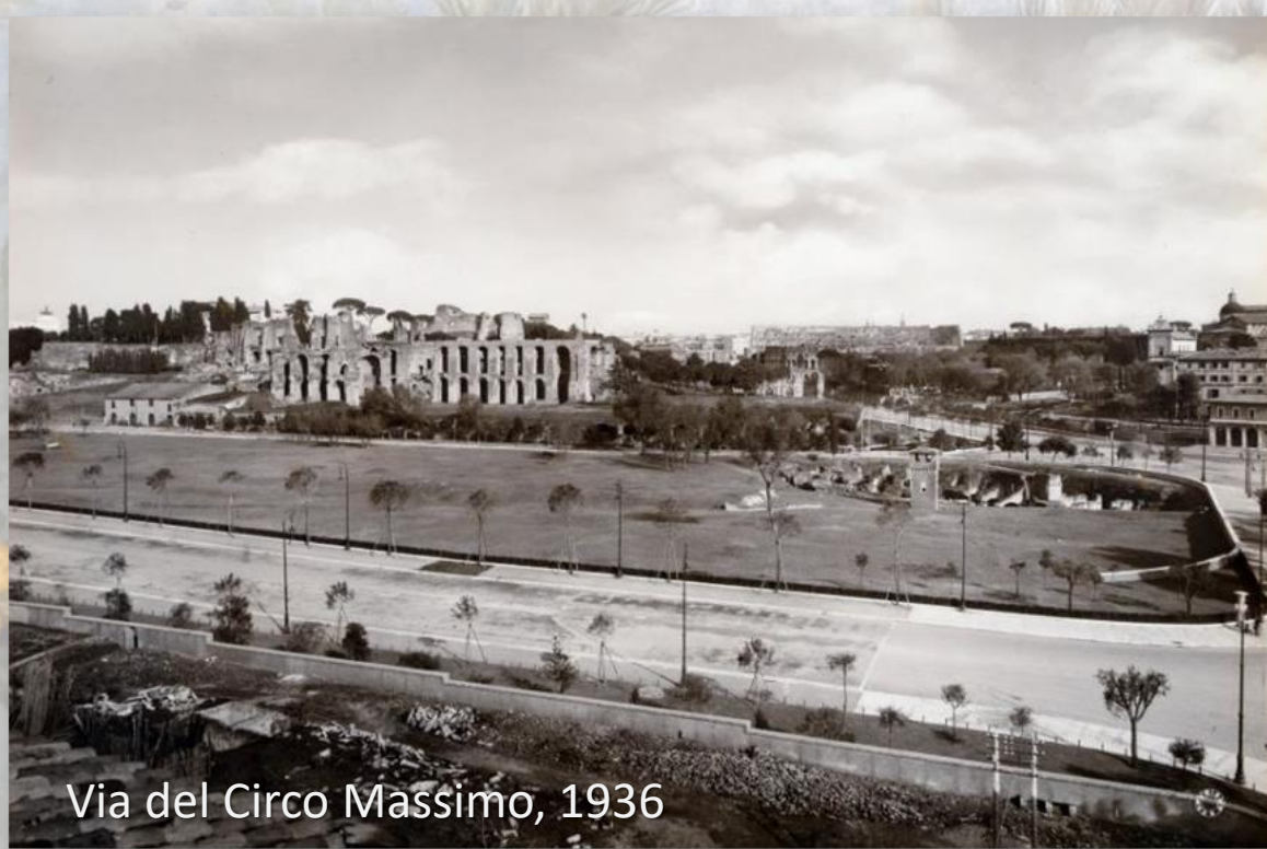
Via del Circo Massimo, 1936