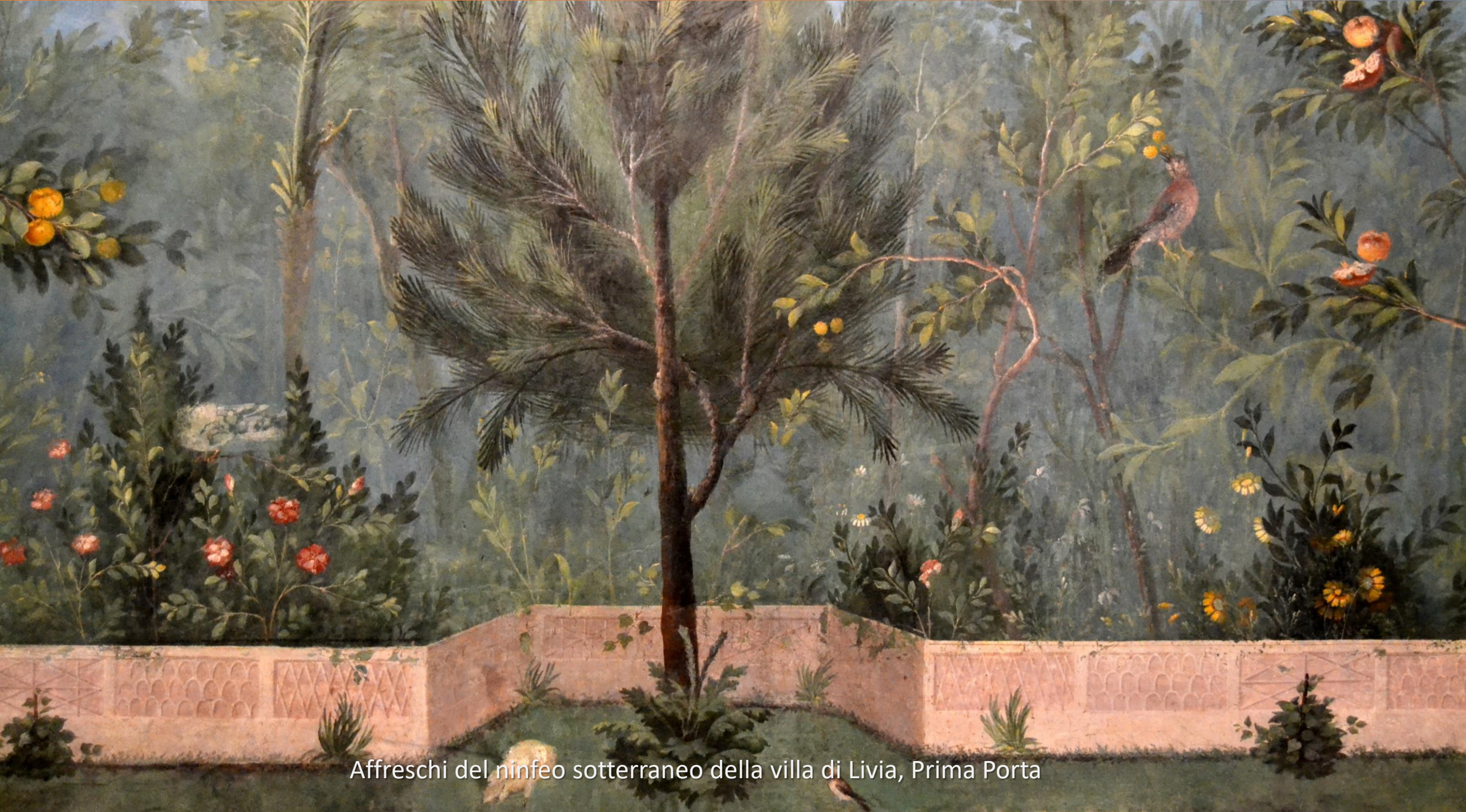
Affreschi del ninfeo sotterraneo della villa di Livia, Prima Porta