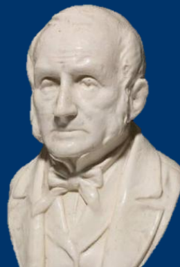
Alessandro Manzoni (1785 – 1873)