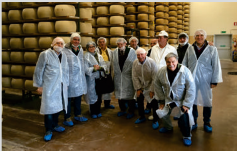
Anno 2017 – Visita al Caseificio Centro Ghiardo, in Ghiardo di Bibbiano (RE)