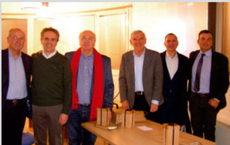
Anno 2019 – Seminario Il racconto del vino romagnolo in Italia e nel mondo (in collaborazione con Assoenologi) presso il Polo di Tebano