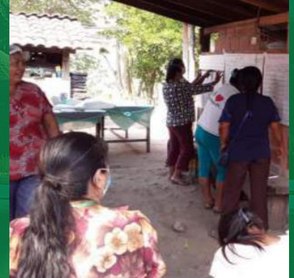
Gestione del PGS e processo di revisione tra pari