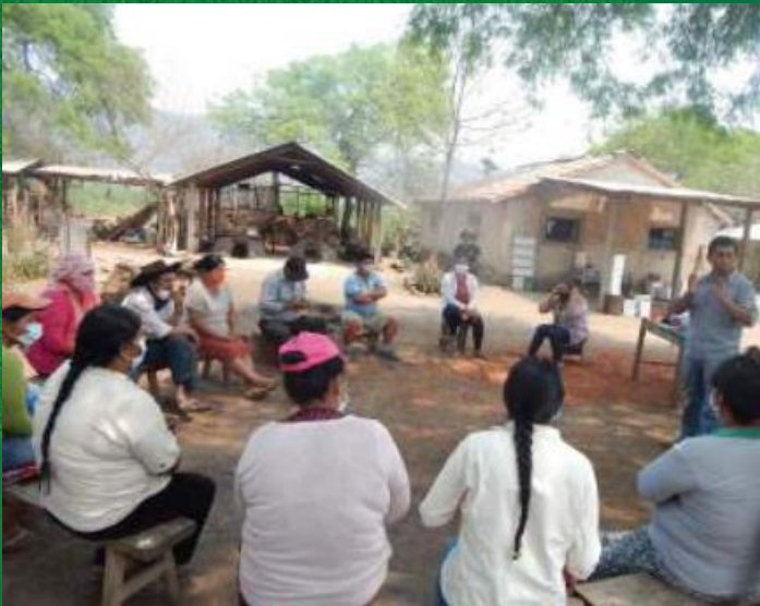
Le parti condividono la loro visione

Seminario sui PGS condotto da IFOAM in Bolivia con I produttori di miele di Melipona