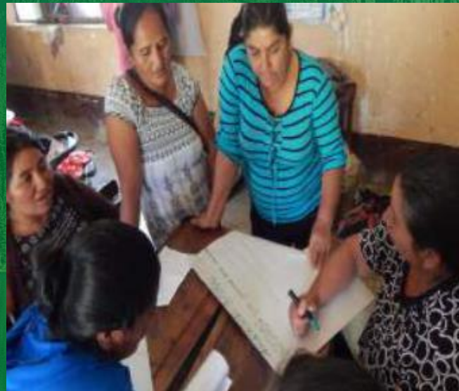
Come funzionerà il PGS