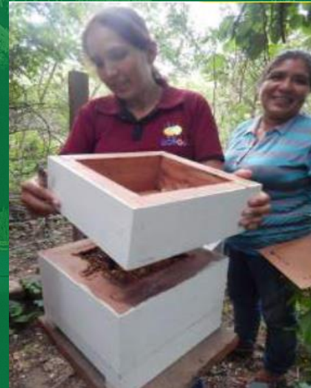
Miele di api senza pungiglione